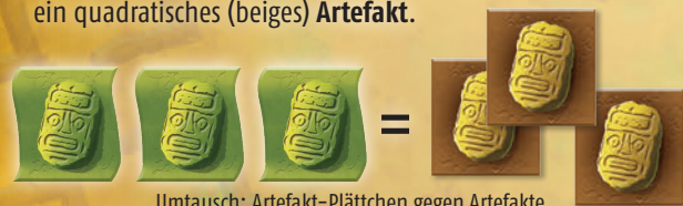
Umtausch: Artefakt-Plättchen gegen Artefakte