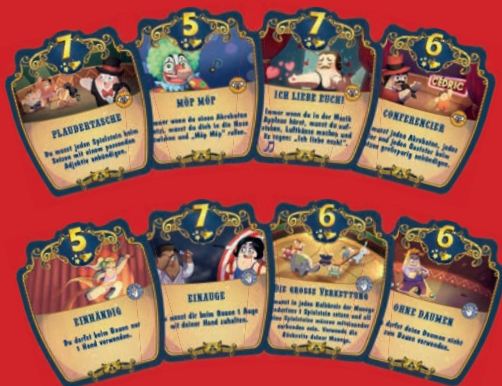
Beispiele für spaßige und technische Darbietungsplättchen

HINWEIS: Ihr erkennt die Darbietungsplättchen der Erweiterung an den Symbolen: spaßig 🎪 und technisch 🖐️.