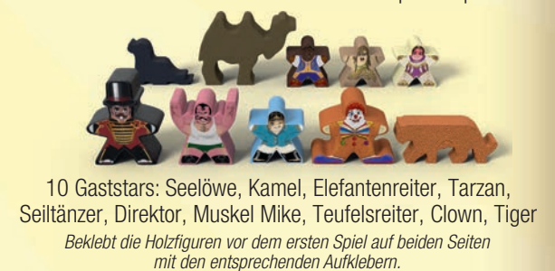
10 Gaststars: Seelöwe, Kamel, Elefantenreiter, Tarzan, Seiltänzer, Direktor, Muskel Mike, Teufelsreiter, Clown, Tiger

Beklebt die Holzfiguren vor dem ersten Spiel auf beiden Seiten mit den entsprechenden Aufklebern.