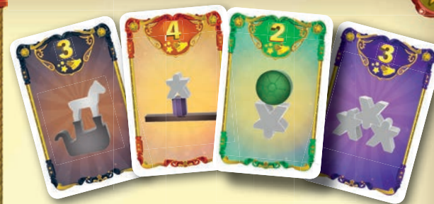
Beispiele für Zuschauerwünsche