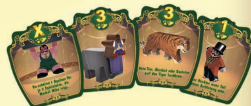
Beispiele für Gaststars

Du erhältst Applaus für den Gaststar entsprechend der Zahl auf seinem Plättchen, wenn du die gezeigte oder beschriebene Darbietung erfüllst.