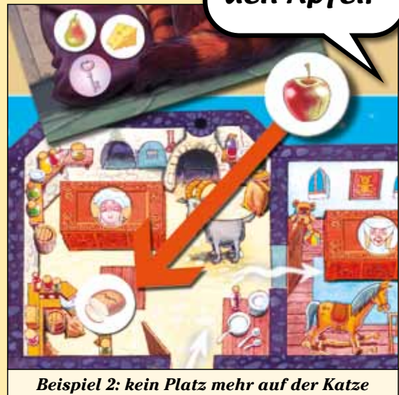
Beispiel 2: kein Platz mehr auf der Katze